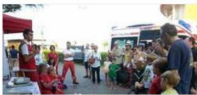
I volontari della Croce Rossa di Arenzano insegnano le manovre salvavita ai passanti

Genova - Arriva finalmente il caldo, portatore di benefici ma anche di insidie che possono colpire soprattutto i più anziani, i malati e i bambini. Come riconoscerle e come intervenire? La Croce Rossa di Arenzano ha organizzato una serie di appuntamenti in spiaggia per insegnare ai cittadini e ai turisti sulle manovre salvavita più comuni.